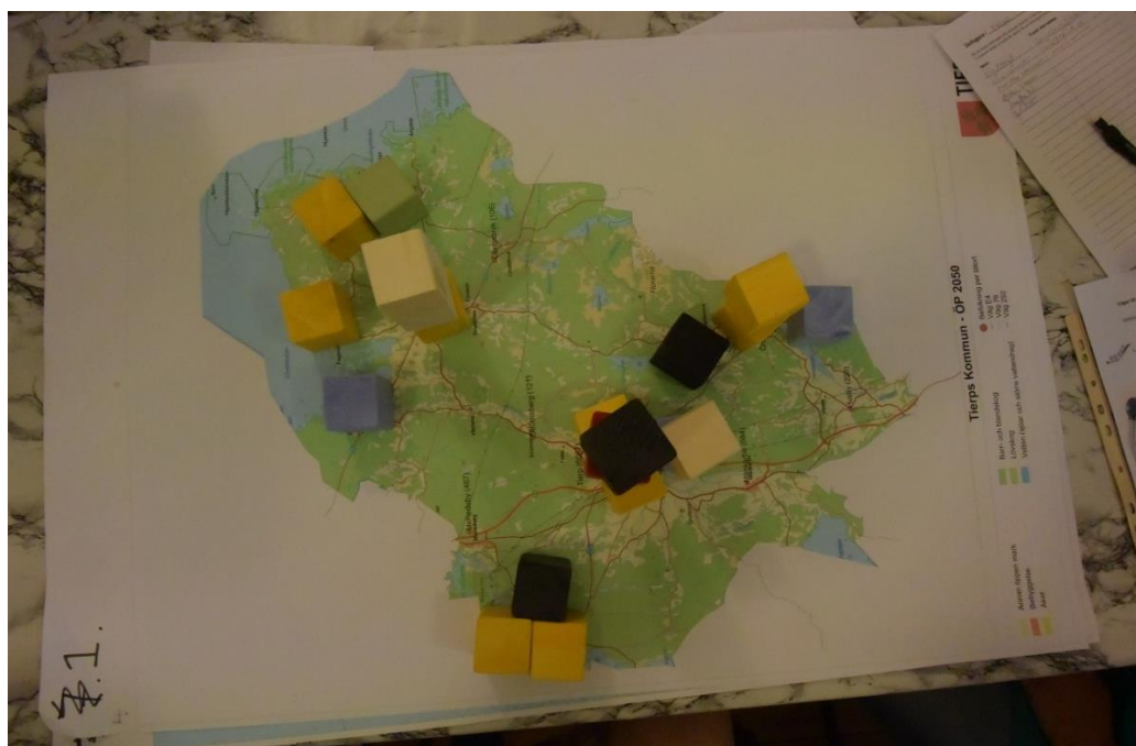
Resultat av klossövning grupp 1 - Hållnäs

Gruppen väljer att bevara naturområdet, efter omröstning.