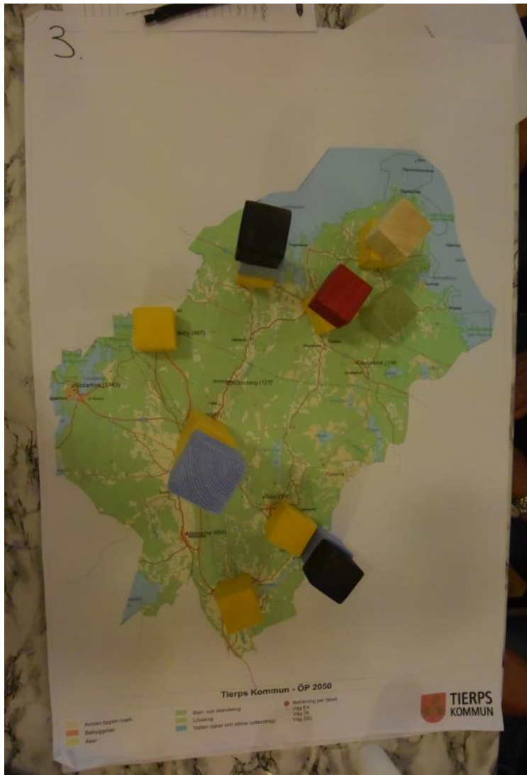
Resultat av klossövning grupp 3 - Hållnäs