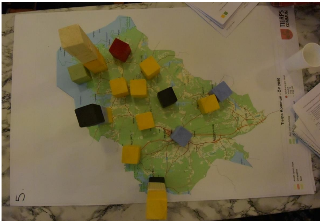
Resultat av klossövning grupp 5 - Hållnäs

Gruppen beslutar att flytta 100 bostäder från Söderfors till Mehedeby.