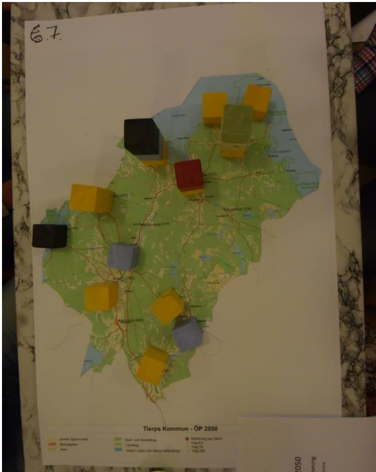
Resultat av klossövning grupp 7 - Hållnäs