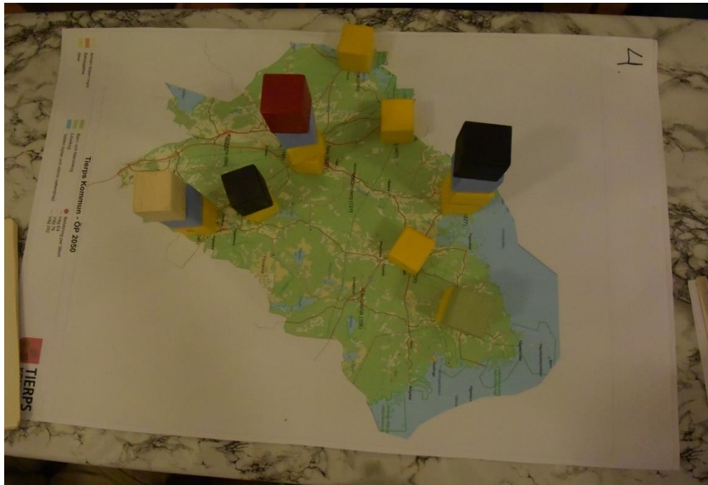
Resultat av klossövning grupp 4 - Hållnäs